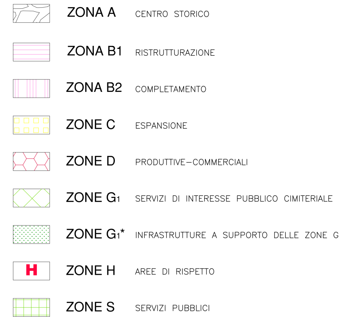
LEGENDA DEL P.U.C. VIGENTE E IN VARIANTE

REGIONE AUTONOMA DELLA SARDEGNA PROVINCIA DEL SUD SARDEGNA